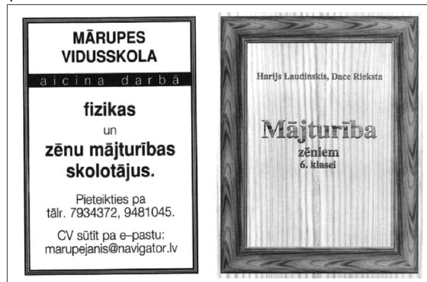
Diena , 2005. gada augusts