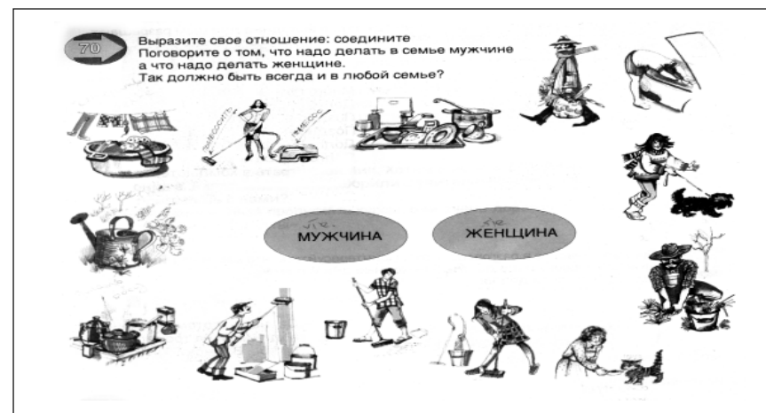
Prosto po russki. Krievu valoda, 2. mācību gads. – Rīga: Retorika A, 2004.

Vēlams, lai mācību grāmatā pēc teksta būtu doti jautājumi, provokatīvi apgalvojumi diskusijai, kas rosinātu skolēnus saskatīt diskriminācijas izpausmes, meklēt risinājumus.