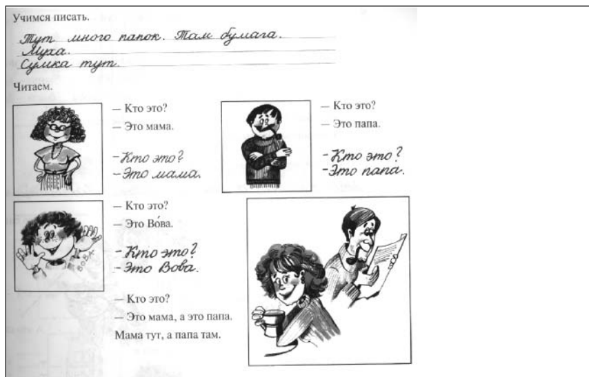
Prosto po russki. Krievu valoda, 1. mācību gads. – Rīga: Retorika A, 2003.

Viena no izglītošanās jomām, kur būtu īpaši jādomā par dzimumu stereotipiem, ir valodu mācību grāmatas. Apgūstot svešvalodu, daudz izmanto attēlus. Tie nekļūdami jāatpazīst, lai netiktu pārprasta vārda semantiskā nozīme. Vārda nozīmes skaidrošanā autori balstās uz savai paaudzei zināmām, nereti stereotipiskām jēdziena izpausmēm. Tādā veidā stereotipi tiek pārnesti uz nākamo paaudzi. Izplatīts dzimuma stereotipu avots svešvalodu mācību grāmatās ir arī didaktiskie dialogi.