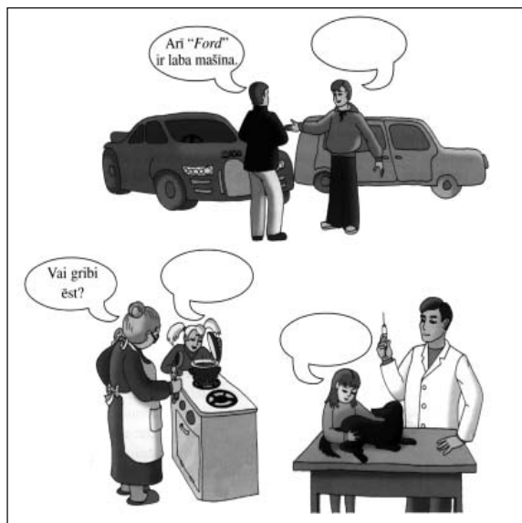
Upe. Latviešu valoda 3. klasei mazākumtautību skolā. – Rīga: LVAVP, 2002.